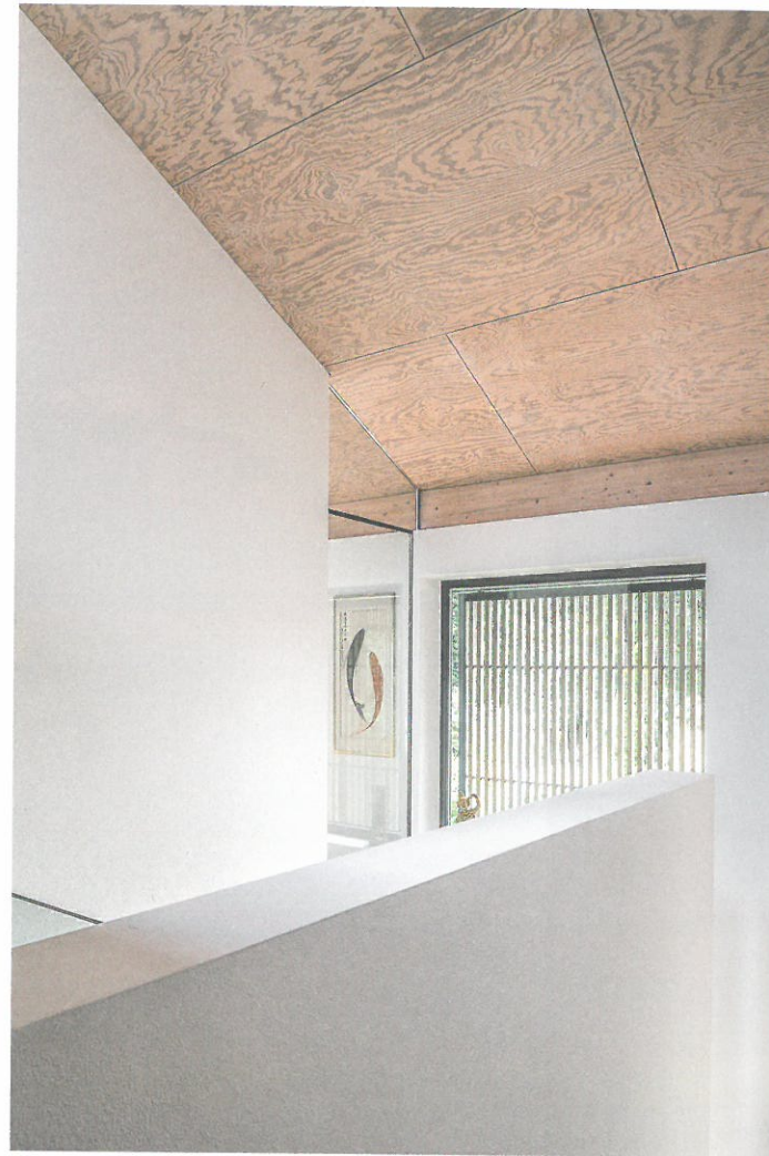
Die Oberflächen – Atmosphären mit Holz, Putz und Glas.

„moderne“ Zeiten überdauert. Das neuzeitliche Bauen mit dem Wunsch nach Individualität zeigt sich bei den neuen Häusern der Nachbarschaft in unterschiedlichsten Erscheinungsformen und bildet neben dem historischen Bestand Spannungsfeld und Kontext.