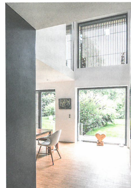
Die Sichtachsen – Verbindung und Orientierung.