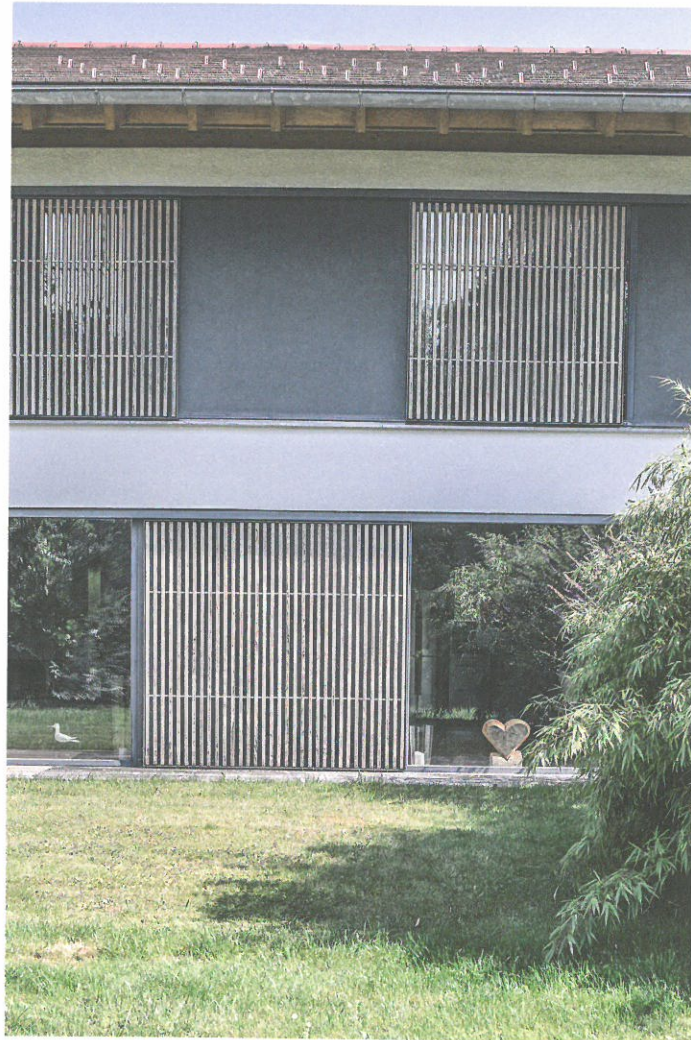
Die Schiebeläden – bewegliche Lebendigkeit zwischen Einblick und Ausblick.