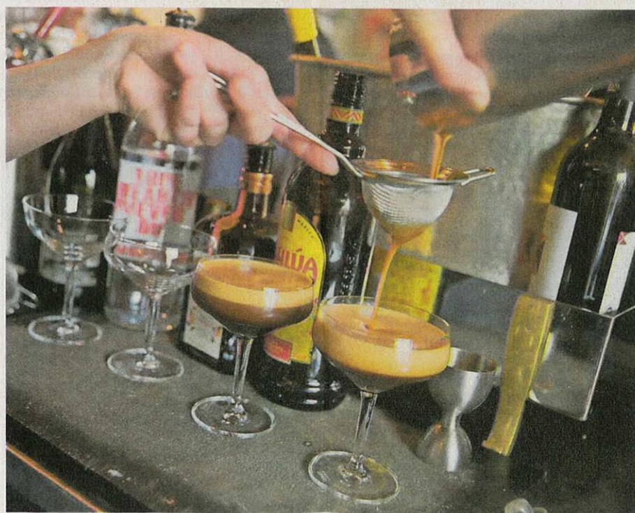
„Boozy Brunch“ bedeutet: Es gibt nicht nur Speisen, sondern auch Drinks, zum Beispiel den Espresso Martini.

Wer sich nicht entscheiden kann, dem ist „Buns & Bites“ (19,50 Euro) zu empfehlen: eine kleine Portion Egg Benedict, dazu Brot mit Aufstrich und Pickles sowie je zwei kleine Portionen griechischer Joghurt und French Toast. Und so viel schon mal vorweg: Die zu letzterem gereichte Mascarpone-Orangen-Creme macht definitiv Lust auf mehr! Für den kleinen Hunger empfiehlt sich das Brot mit gegrilltem Ziegenkäse, Honig und Birne (12,50 Euro). Das ist übrigens, wie viele andere Gerichte auf der Karte, vegetarisch.