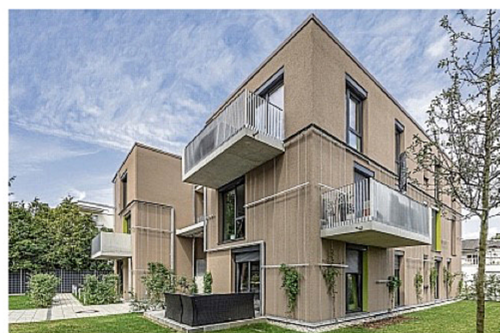
Ein Mehrfamilienhaus hat die Gemeinde Ottobrunn an der Hochäckerstraße 8 mit den Riemerlinger Architekten Gassner-Zarecky gebaut. Interessierte können am Samstag, 28. Juni, von 14 bis 16 Uhr Einblicke bekommen.