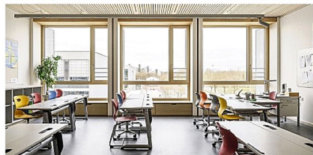
Moderne Klassenzimmer: Den Anbau der Unterhachinger Grund- und Mittelschule am Sportpark hat das Münchner Büro Schankula entworfen, einer Führung kann man sich am Samstag, 28. Juni, von 14.30 bis 15.30 Uhr anschließen.

Dieses Büro ist ein guter Bekannter bei den „Architektouren“: „Gassner & Zarecky“ aus Riemerling, einem Ortsteil von Hohenbrunn, sind fast jedes Jahr mit einem Projekt vertreten. Diesmal haben sie im Auftrag der Gemeinde Ottobrunn