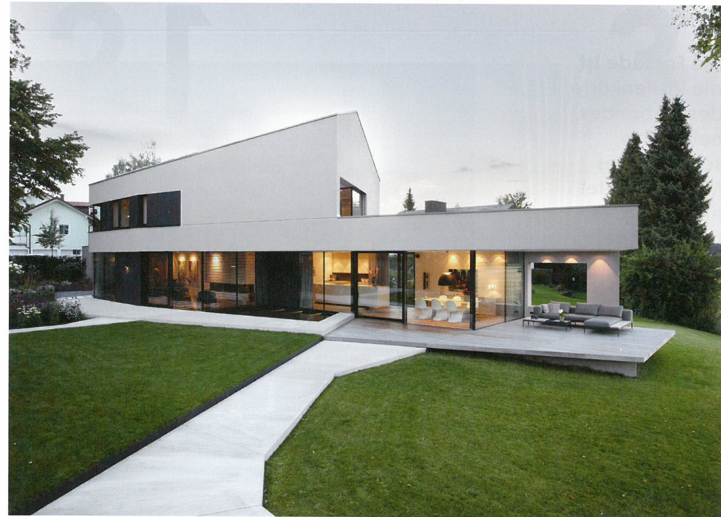
Der Bauherr wünschte sich einen fließenden Wohnraum im Erdgeschoss, der sich nach draußen fortsetzt. Ausgeführt mit Hilfe einer rahmenlosen Verglasung

„Das Innen und Außen im Fluss halten“ – nach dieser Bauherrenvorgabe plante das Architekturbüro Gassner & Zarecky ein Einfamilienhaus am Ortsrand von Gräfing bei München. Das Grundstück bietet nach Osten einen weiten Blick über die umliegenden Felder, der maßgeblich den Entwurf bestimmte. Das Konzept nimmt aber auch die anderen Richtungen des Grundstücks auf: im Osten die Felder, im Süden den Garten und schließlich die Zufahrt, die sich nicht im geraden Winkel zur Straße ausrichtet, sondern sich samt Garage schräg nach Nordwesten erstreckt und dem Grundstück damit mehr Privatheit verschafft. In stumpfem Winkel zur Garage schließt das lang gestreckte Wohngebäude an, das sich transparent und offen auf die Felder ausrichtet. Die polygonale Kubatur des Hauses überrascht mit sorgfältig ausgearbeiteten Details, die geprägt sind vom Mut des Weglassens. Die schlichte Fassadengestaltung aus Putz und Glas setzt sich im Inneren fort.